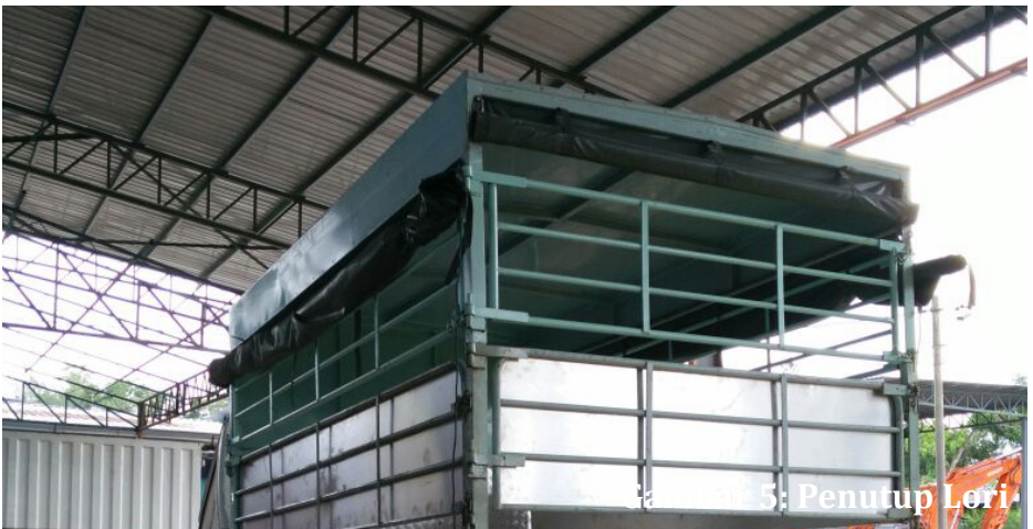
Gambar 5: Penutup Leri