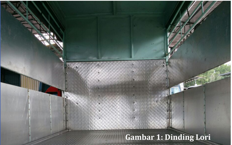
Gambar 1: Dinding Lori