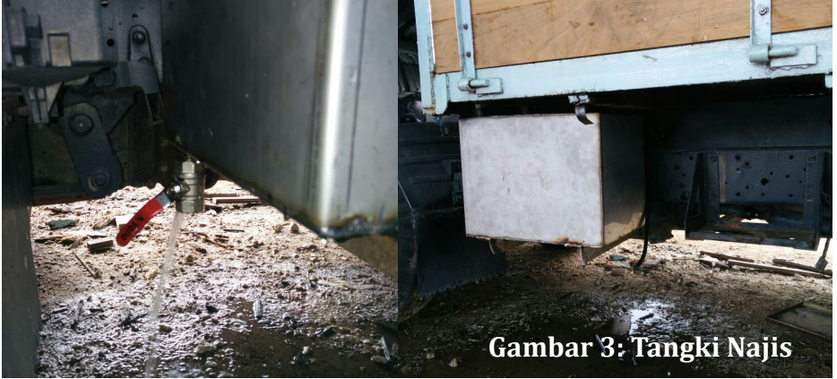
Gambar 3: Tangki Najis