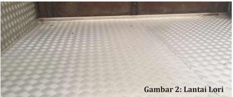
Gambar 2: Lantai Lori